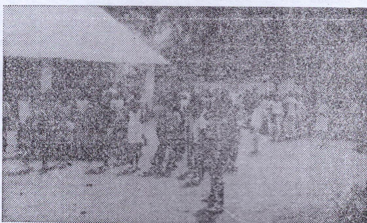
Un groupe d'enfants — candidats attendant impartiemment l'heure «H» de l'appel

A Rio de Janeiro, la foule a mis à sac le magasin d'un portugais dont le propriétaire avait célébré la victoire de son équipe nationale en tirant des feux d'artifice. Partout, les mines sont allongées et vers la fin du match mardi soir à pu voir des gens pleurer et même prier.